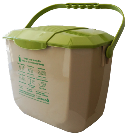
Cubeta para residuos orgánicos – INTERIOR