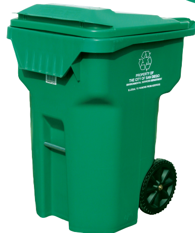
Contenedor verde – EXTERIOR