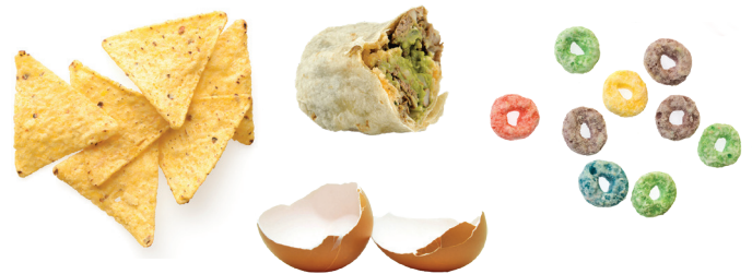
Thức ăn thừa không ăn được, Trứng và Vỏ trứng