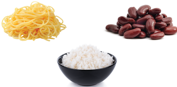
Mì ống, Ngũ cốc, Gạo và Đậu