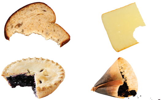
Bánh mì, Bã và Giấy lọc Cà phê, Phô mai và Bánh ngọt